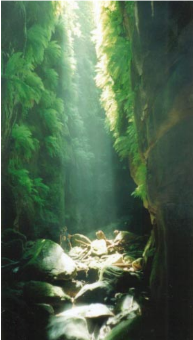
En vacker bild vid en av Australiens allra tuffaste cacher, klassad 5/5. Kräver cirka 10 timmars klättring och hike. Kolla in cachen GC369E.