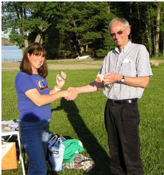
Bo tar emot specialpriset TB Orientering från Snorkfröken

Vi väntar med spänning på det första eventet där en geocachare står som vinnare.