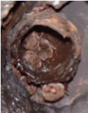
Fladdermöss i "Industrial Evilness"

I vissa delstater i USA börjar man prata om att delstaten kommer att kräva en geocaching-licens med försäkring för att man skall få cacha i offentliga parker. Man har redan i några delstater börjat ta betalt för att folk skall få placera ut en cache, och den måste först godkännas av parkförvaltningen som pekar ut en plats åt dig. Allt för att folk inte skall skada sig och stämma delstaten för att den inte stoppade cachen på deras mark.