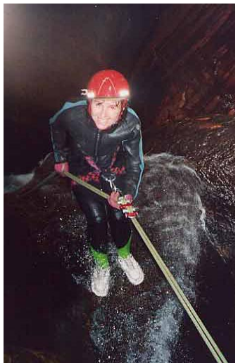
En kvinnlig cachare som försöker sig på en av Australiens allra svåraste cacher, klassad 5/5.

Läs mer om Extremcaching på nästa sida >>>>